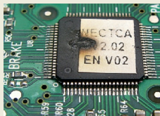
сгоревший процессор магнитолы

Внимание: провод «TV-CONT» выходящий из головного устройства может быть подключен только к проводу «TV-CONT» ТВ-тюнера.